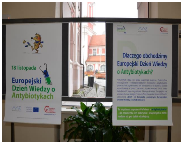
SIEDZIBA URZĘDU MIASTA POZNANIA LISTOPAD 2016 R.