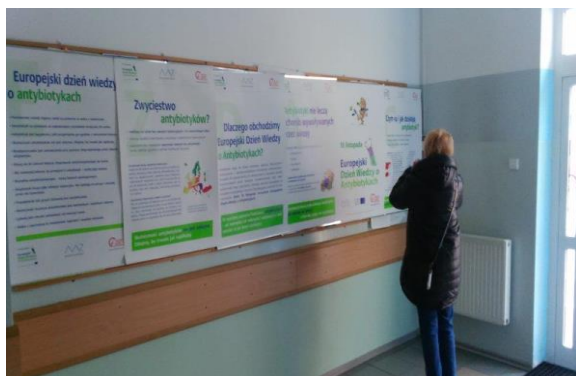
NZOZ Eskulap, Białogard LISTOPAD 2016 R.